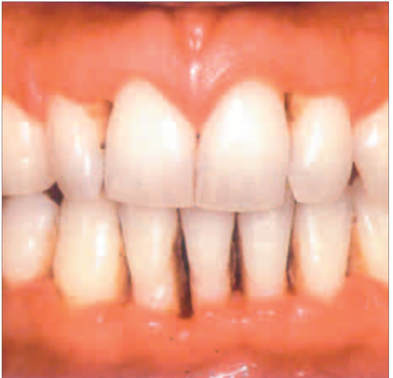
Problemas. Una boca con piorrea, una enfermedad bucal que no es difícil de detectar.

Los diabéticos deben tener un control exhaustivo de las encías, para evitar complicaciones dentarias y de salud